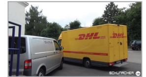
4. Versand > Express-Service