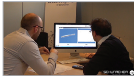
2. Konstruktion > 3D-Variantenkonstruktion