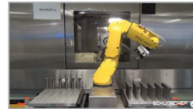
3. Produktion > ‚State of the Art‘ – Maschinenpark