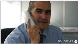
1. Bestellung > Marktorientierte Preisgestaltung